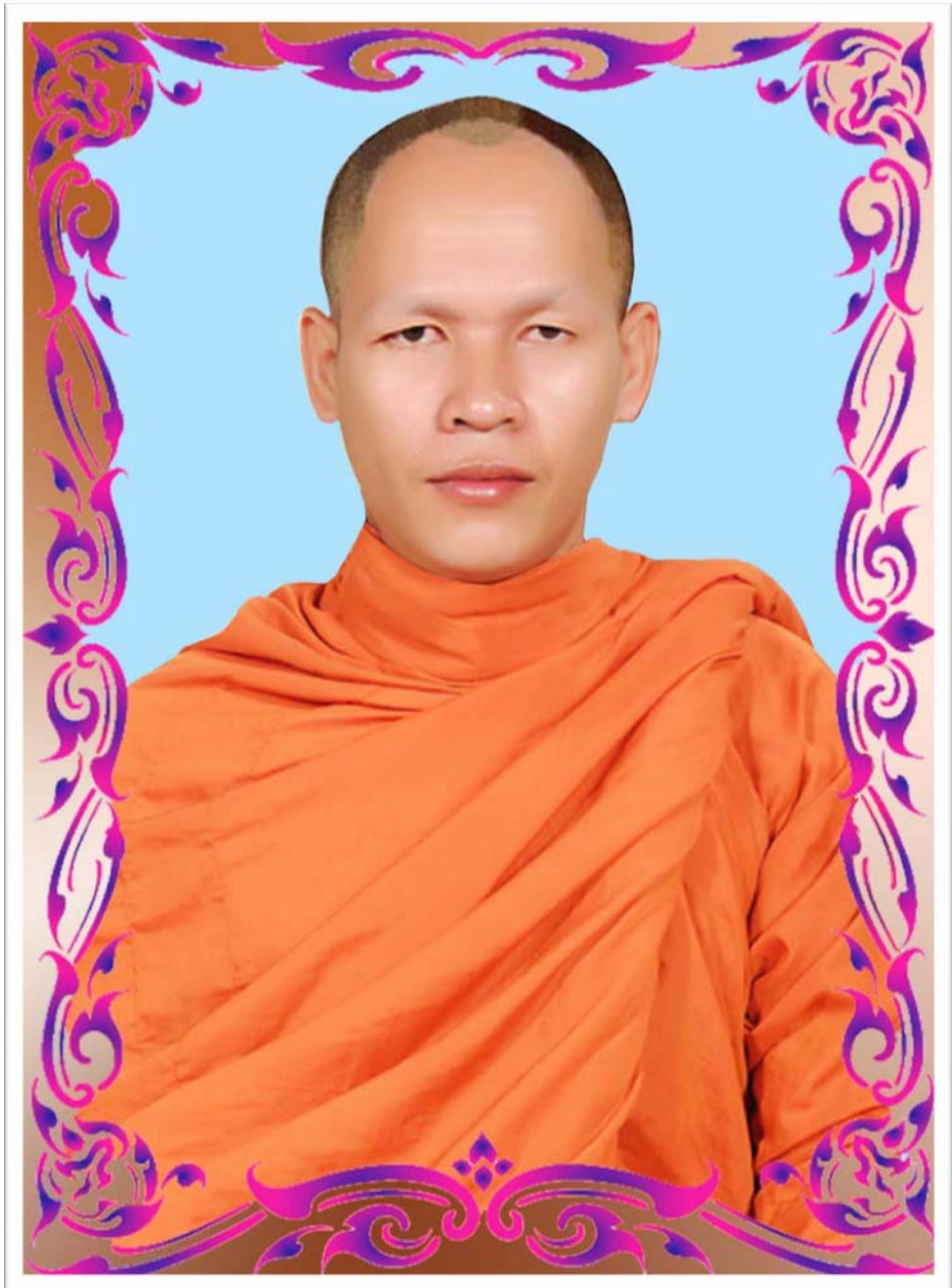
ဦးစွာ ဣန္ဒြေဝေ ဘဝံ-ဗုဒ္ဓိန္ဒြေ